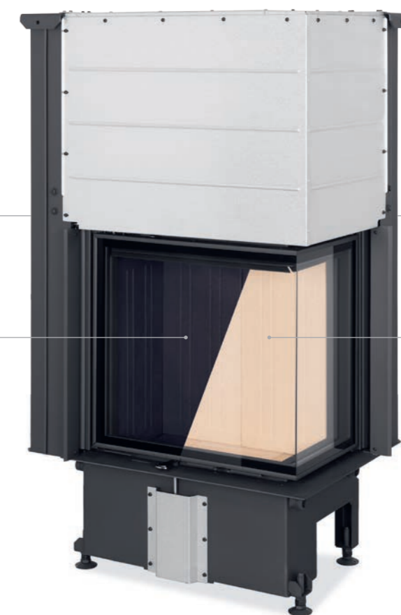
Černý probarvený šamot