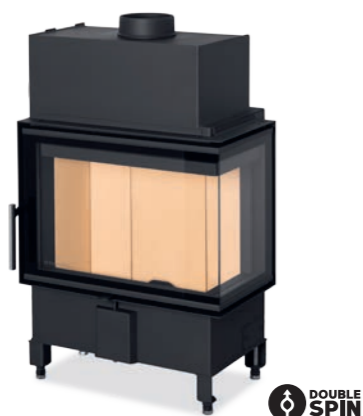
HEAT R/L 2G S 60.44.33.23