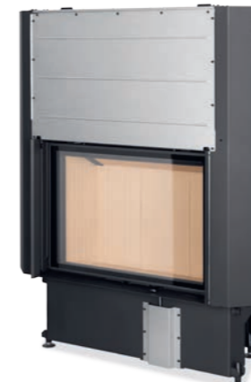
IMPRESSION 2G L 80.60.01