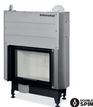
HEAT 3G L 66.50.04