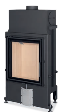
IMPRESSION 2G 55.60.01