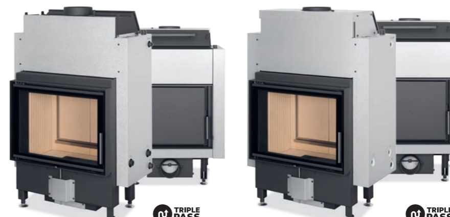
DYNAMIC WB 2G 66.50.01