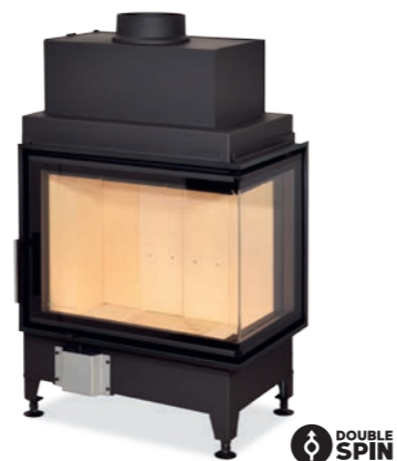
HEAT R/L 2G S 65.51.40.21