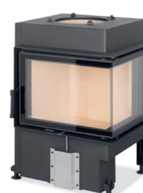
DYNAMIC R/L 3G S 55.44.42.21