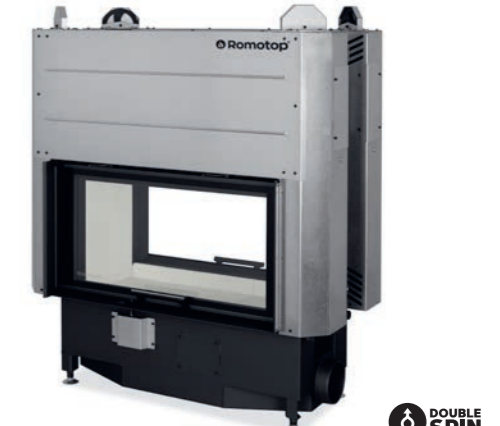
HEAT T 3G L 88.50.04 obj. kód: HT3LF 04

Průhledová, výsuvná dvířka P R 5,8–15,1 kW % 80,5% Ø 200 mm N 466 × 851 mm