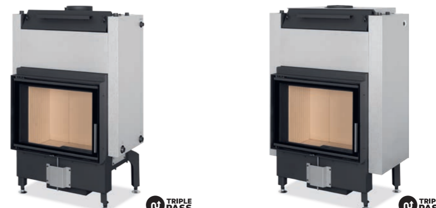
DYNAMIC W 2G 66.50.01