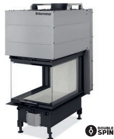
HEAT U 3G L 50.52.70.24 obj. kód: HU3LF 24

Třístranná, dělené sklo P R 5,0–13,0 kW % 82,7% Ø 200 mm N 468 × 502 × 696 mm