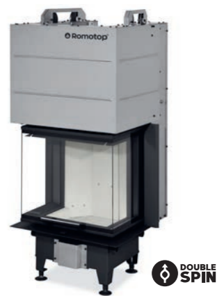
HEAT C 3G L 50.52.31.24 obj. kód: HC3LE 24

Třístranná, dělené sklo P R 2,9–7,4 kW % 82,1% Ø 150 mm N 468 × 504 × 305 mm