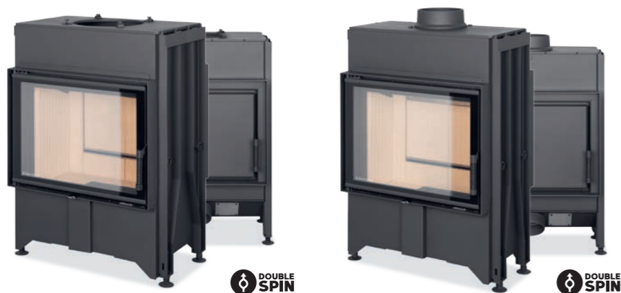
DYNAMIC B2G 66.50.01N