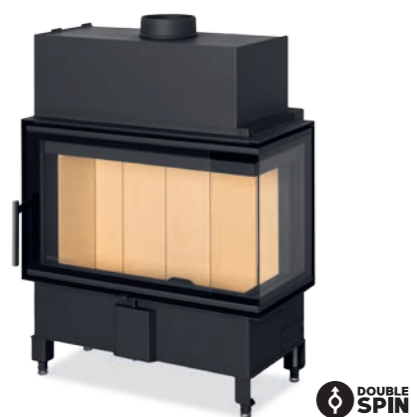
HEAT R/L 2G S 70.44.33.23