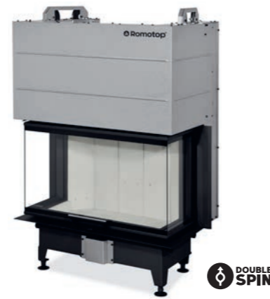
HEAT C 3G L 80.52.31.24 obj. kód: HC3LJ 24

Třístranná, dělené sklo P R 5,0–12,9 kW % 80,4% Ø 200 mm N 468 × 804 × 305 mm