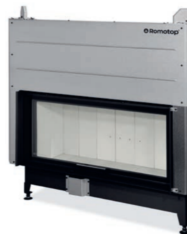
HEAT 3G L 110.50.04