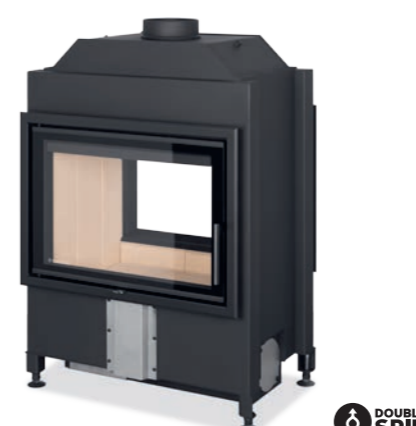
HEAT T 3G 70.50.01 obj. kód: HT3Z 01

Průhledová P R 4,0–10,3 kW % 82,3% Ø 180 mm N 467 × 664 mm