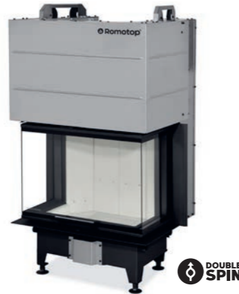
HEAT C 3G L 65.52.31.24 obj. kód: HC3LH 24

Třístranná, dělené sklo P R 3,9–10,1 kW % 82,9% Ø 200 mm N 468 × 654 × 305 mm