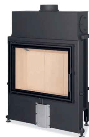
IMPRESSION 2G 80.60.01