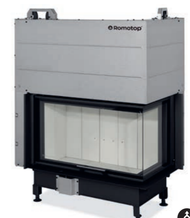
HEAT R/L 3G L 81.51.40.24