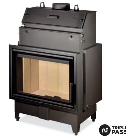
HEAT W 2G 70.50.01