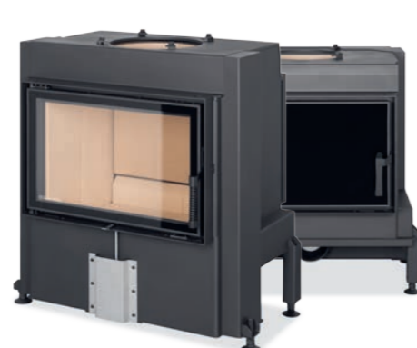
DYNAMIC B3G 66.44.01