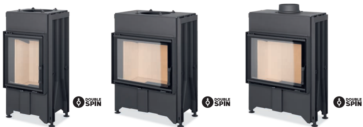
DYNAMIC 2G 44.55.01N