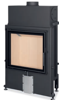
IMPRESSION 2G 67.60.01