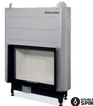
HEAT 3G L 88.66.04