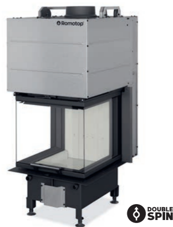
HEAT U 3G L 50.52.50.24 obj. kód: HU3LG 24

Třístranná, dělené sklo P R 4,0–10,4 kW % 83,3% Ø 200 mm N 468 × 502 × 496 mm