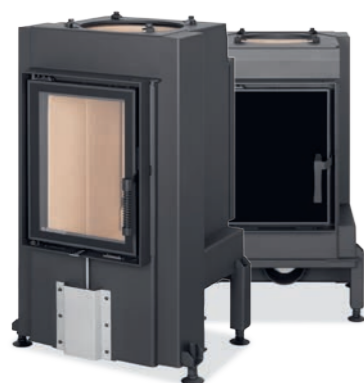
DYNAMIC B3G 38.50.01