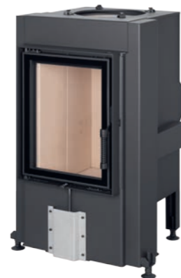
DYNAMIC 3G 44.55.01