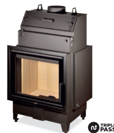
HEAT W 2G 59.50.01