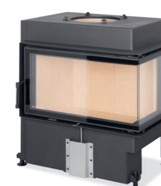
DYNAMIC R/L 3G S 72.44.42.21