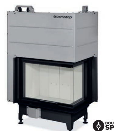
HEAT R/L 3G L 65.51.40.24