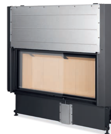
IMPRESSION 2G L 118.60.01