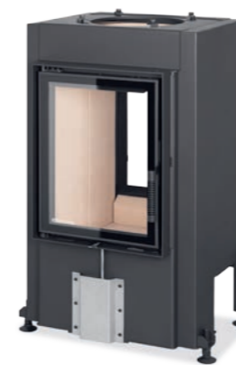
DYNAMIC T 3G 44.55.01