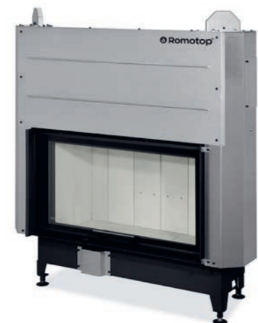
HEAT 3G L 88.50.04