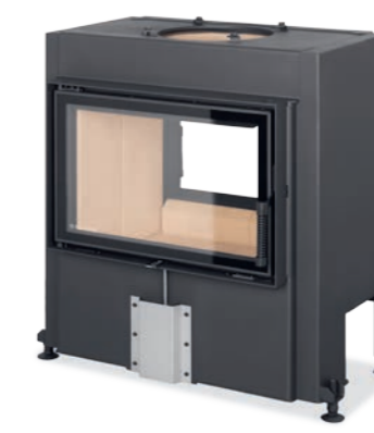
DYNAMIC T 3G 66.44.01