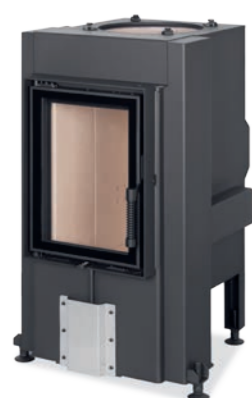
DYNAMIC 3G 38.50.01