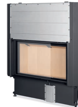
IMPRESSION 2G L 93.60.01