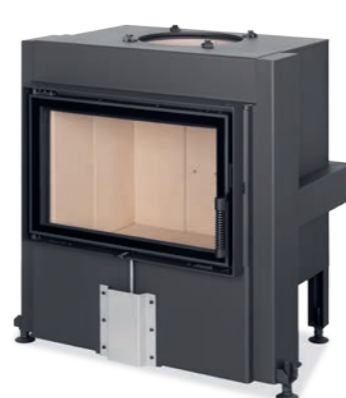
DYNAMIC 3G 66.44.01